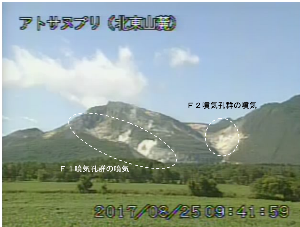
図2 アトサヌプリ 北東側から見た山体の状況 (8月25日、北東山麓監視カメラによる)