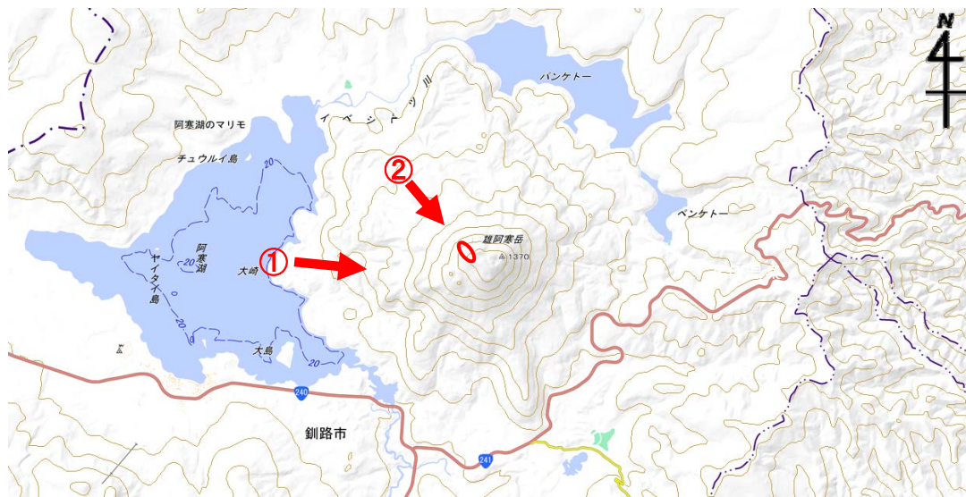
図 1 雄阿寒岳 周辺図

（矢印は写真及び赤外熱映像の撮影方向、赤丸はこれまで確認されている地熱域を示します）