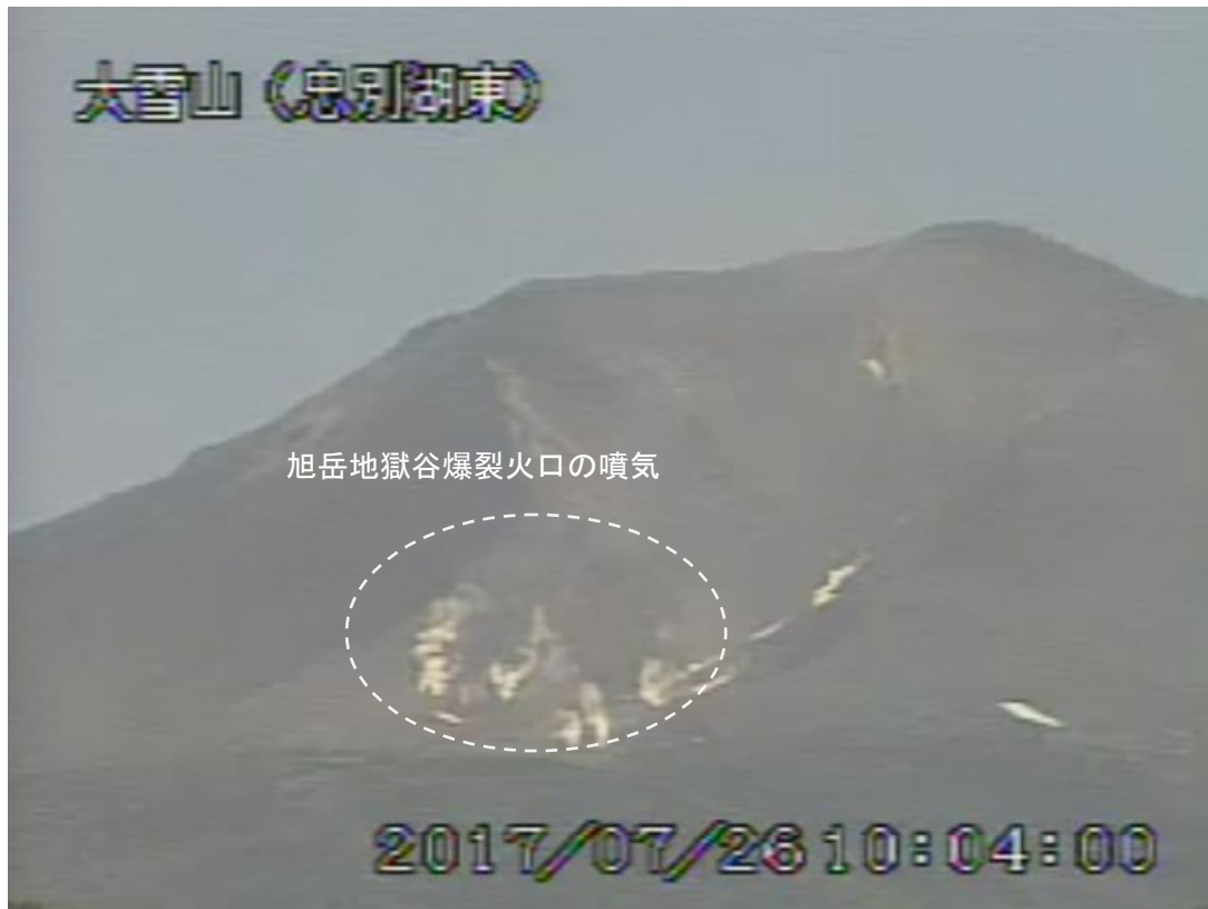
図2 大雪山 西側から見た旭岳の状況 (7月26日、忠別湖東監視カメラによる)