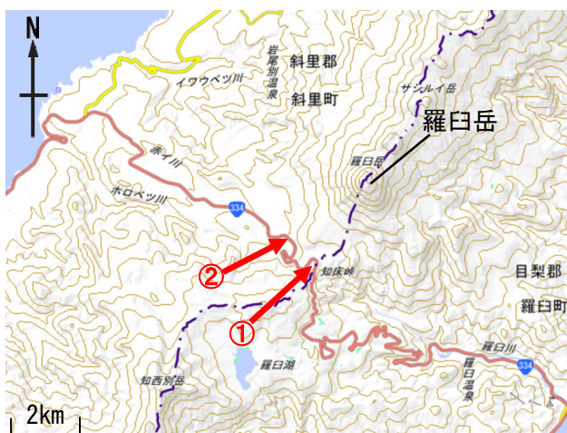
図 1 羅臼岳 周辺図と赤外熱映像及び写真の撮影方向（矢印）

1) 赤外熱映像装置は、物体が放射する赤外線を検知して温度や温度分布を測定する計器で、熱源から離れた場所から測定できる利点がありますが、測定距離や大気等の影響で熱源の温度よりも低く測定される場合があります。