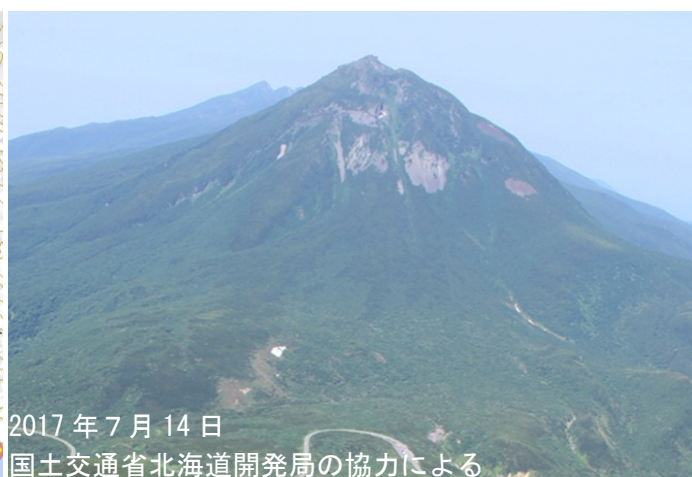
図 2 羅臼岳 全景写真 図 1 の①から撮影