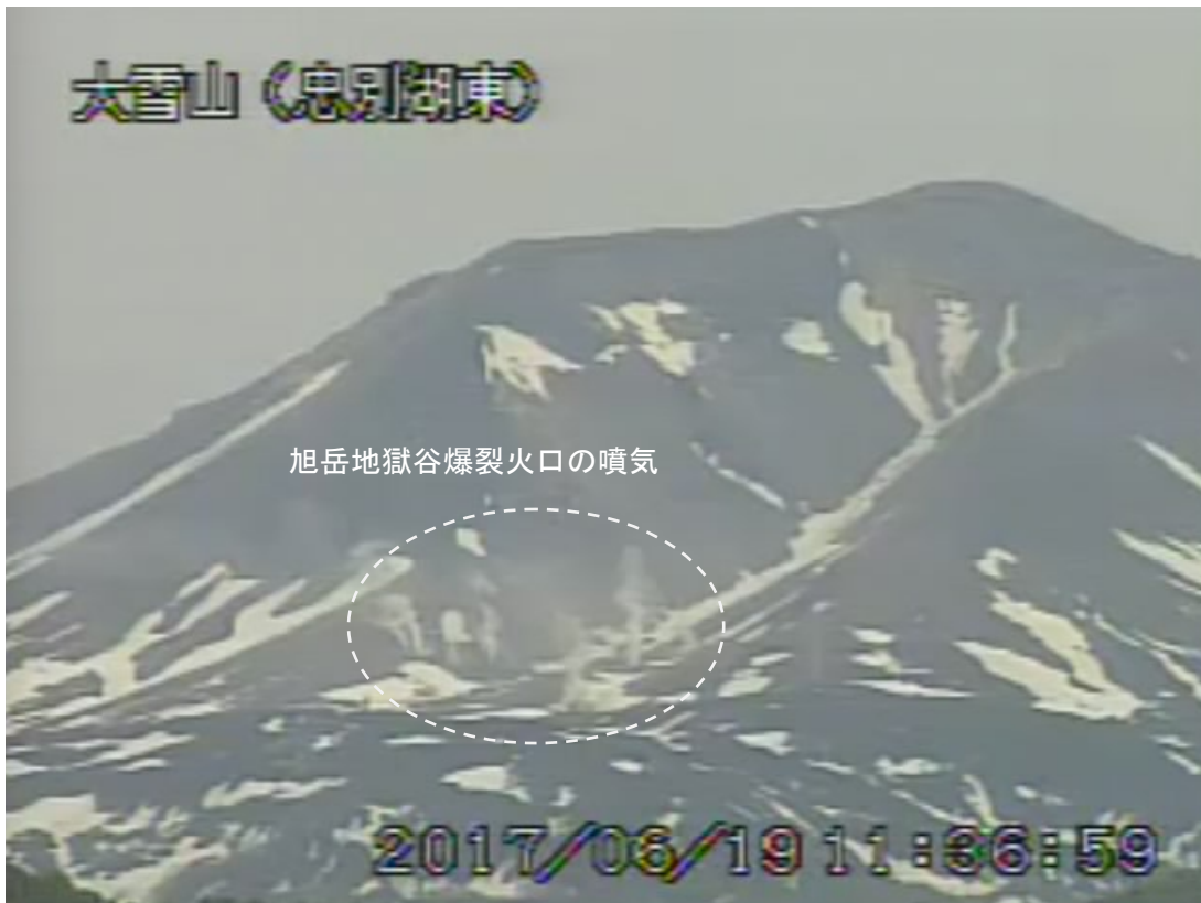
図2 大雪山 西側から見た旭岳の状況（6月19日、忠別湖東監視カメラによる）