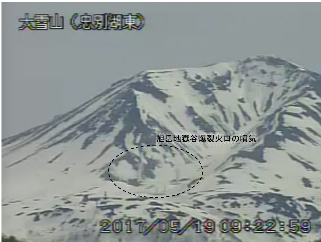
図2 大雪山 西側から見た旭岳の状況（5月19日、忠別湖東監視カメラによる）