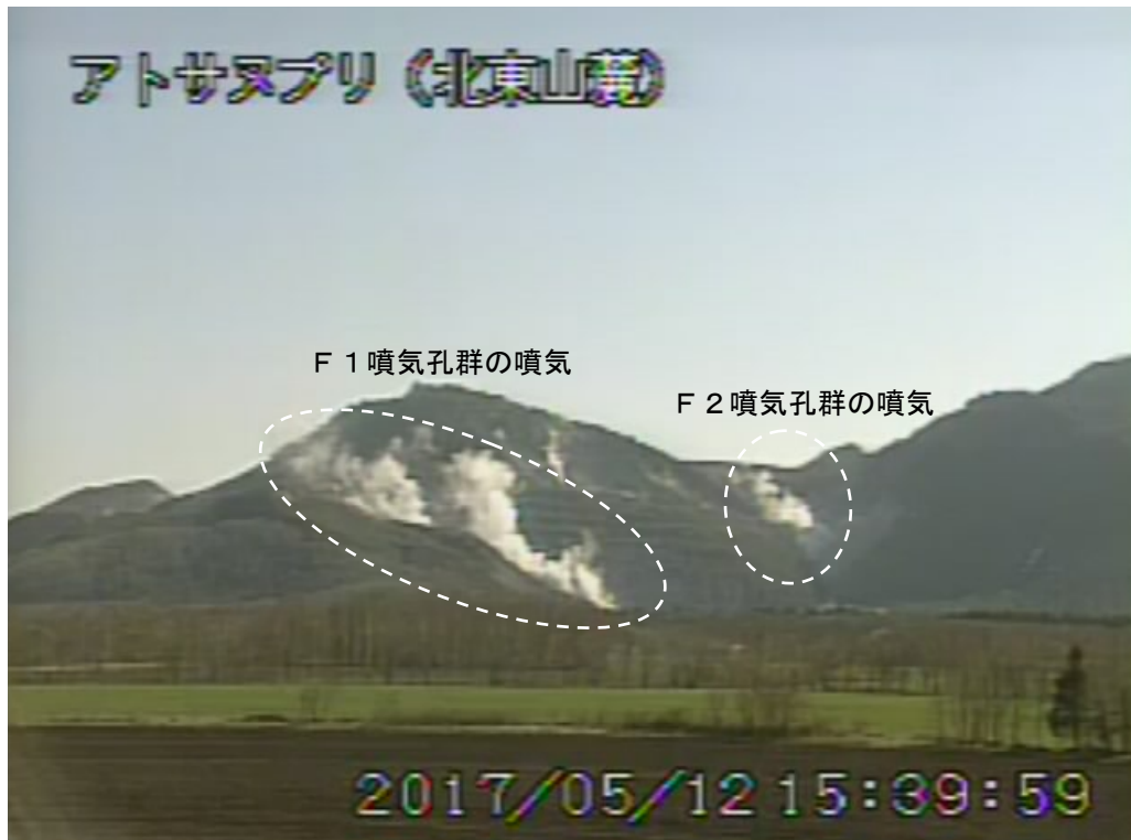
図2 アトサヌプリ 北東側から見た山体の状況 (5月12日、北東山麓監視カメラによる)