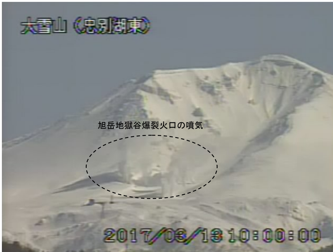
図2 大雪山 西側から見た旭岳の状況 (3月13日、忠別湖東監視カメラによる)