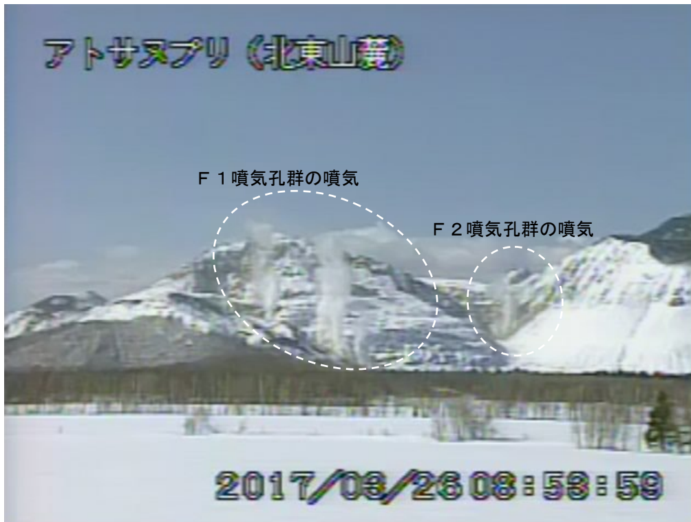
図2 アトサヌプリ 北東側から見た山体の状況 (3月26日、北東山麓監視カメラによる)