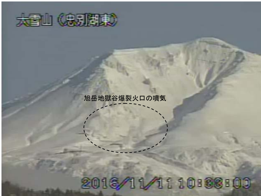
図2 大雪山 西側から見た旭岳の状況 (11月11日、忠別湖東遠望カメラによる)