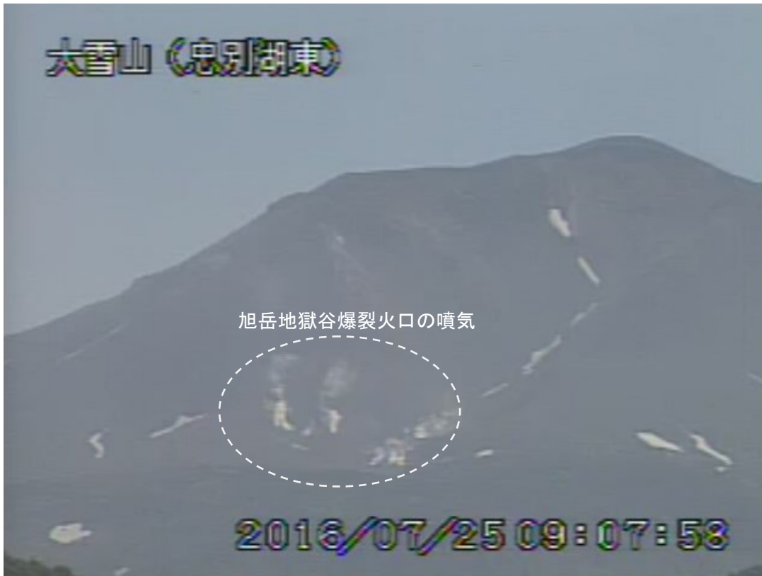
図2 大雪山 西側から見た旭岳の状況 (7月25日、忠別湖東遠望カメラによる)