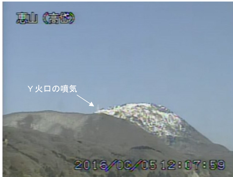
図1 恵山 西南西側から見た山頂部の状況（3月5日、 たかだい 高岱遠望カメラによる）

1) GNSS (Global Navigation Satellite Systems) とは、GPS をはじめとする衛星測位システム全般を示す呼称です。