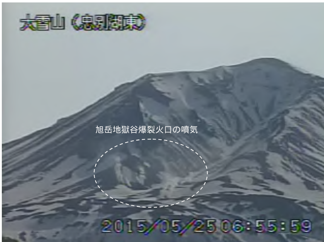
図2 大雪山 西側から見た旭岳の状況(5月25日、 ちゅうべつこひがし 忠別湖東遠望カメラによる)