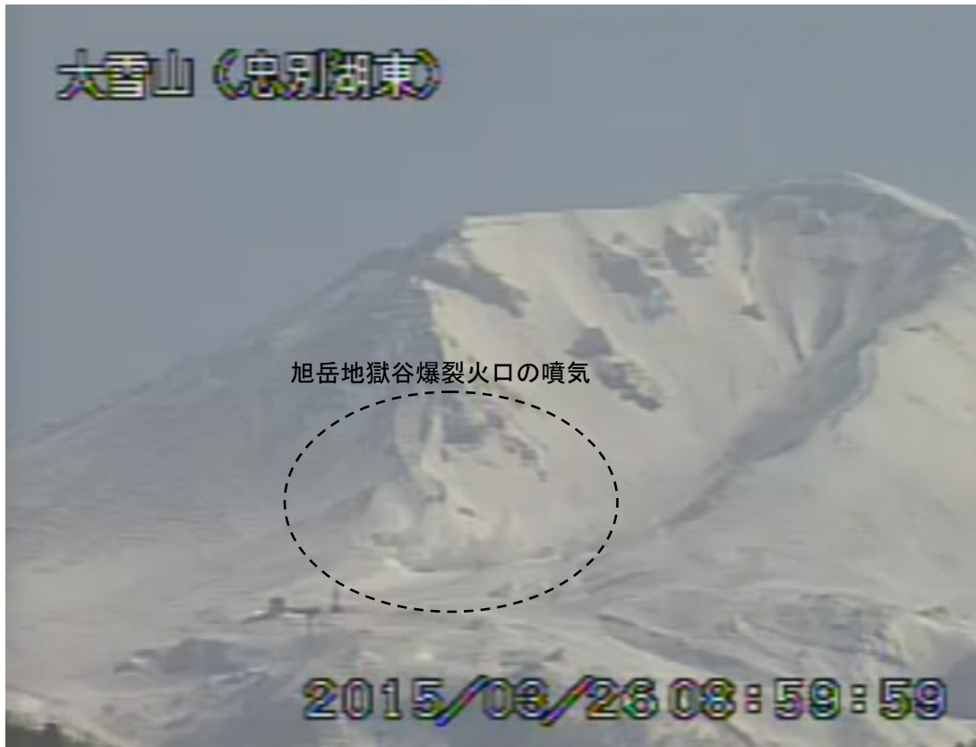
図2 大雪山 西側から見た旭岳の状況 (3月26日、忠別湖東遠望カメラによる)