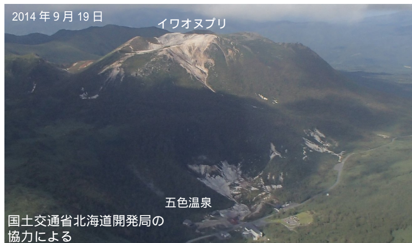
図1 ニセコ イワオヌプリ、五色温泉周辺の状況 南側上空(図2の矢印方向)から撮影

19日に上空からの観測(国土交通省北海道開発局の協力による)を実施しました。イワオヌプリ(硫黄山)山頂部や五色温泉周辺に噴気は認められませんでした。