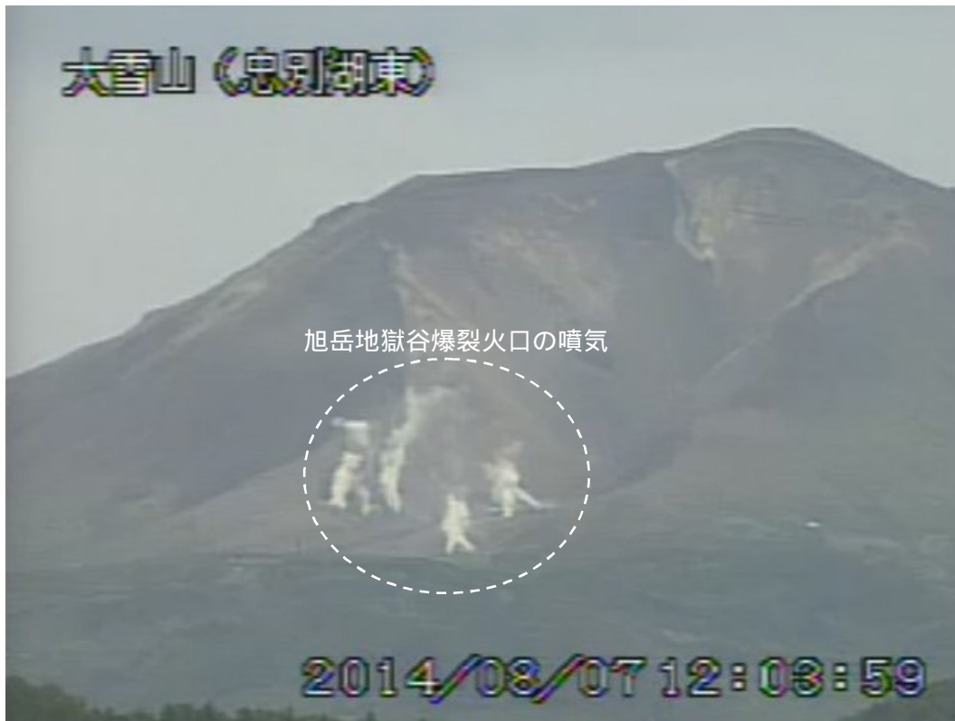
図 2 大雪山 西側から見た旭岳の状況（8月7日、 ちゅうべつこひがし 忠別湖東遠望カメラによる）