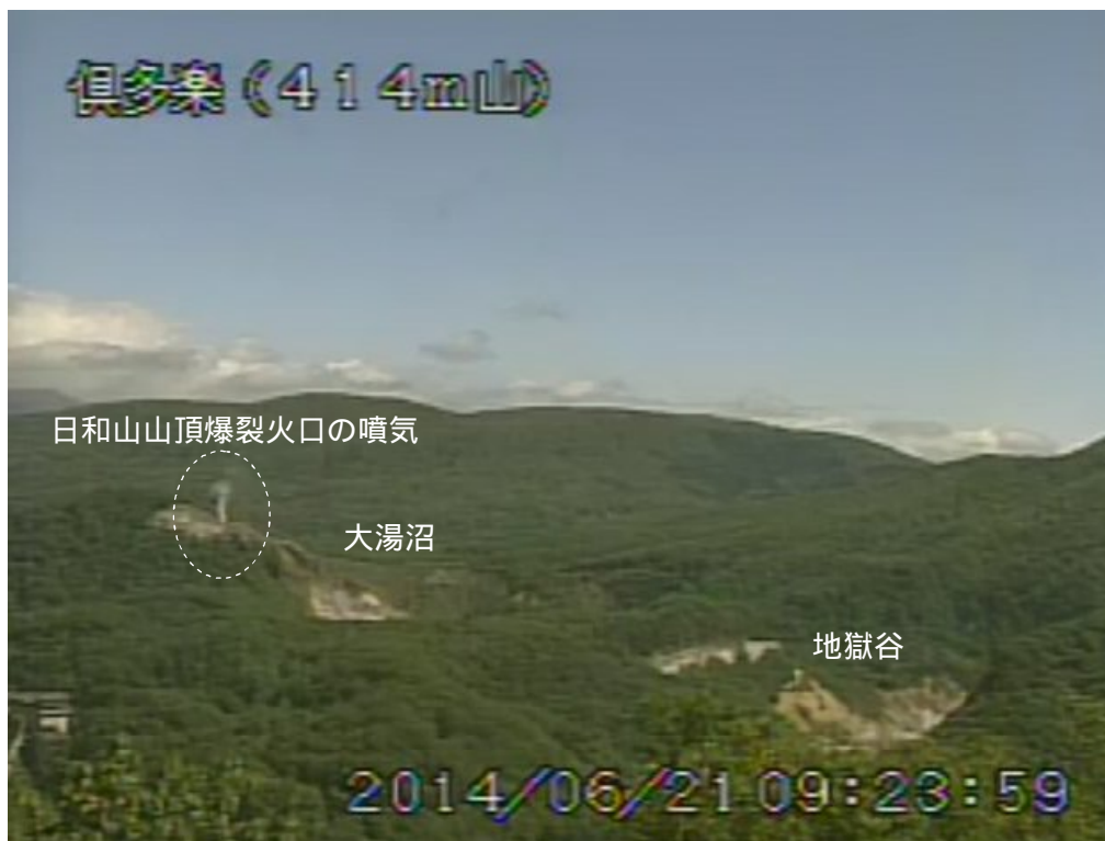
図2 倶多楽 南南西側から見た日和山、大湯沼及び地獄谷周辺の状況（6月21日、414m山遠望カメラによる）