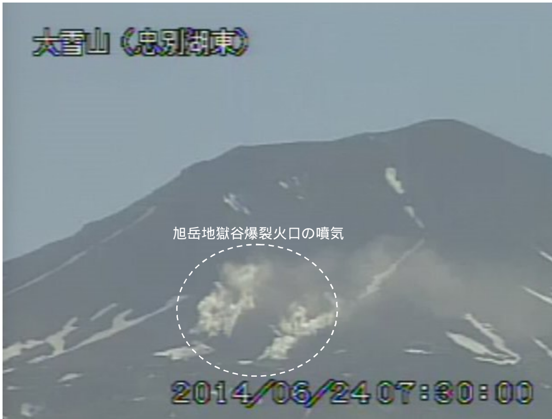
図2 大雪山 西側から見た旭岳の状況（6月24日、 ちゅうべつこひがし 忠別湖東遠望カメラによる）