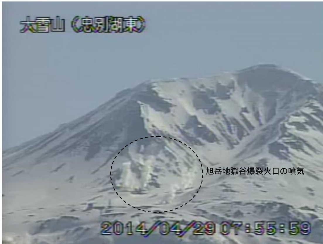
図2 大雪山 西側から見た旭岳の状況（4月29日、忠別湖東遠望カメラによる）