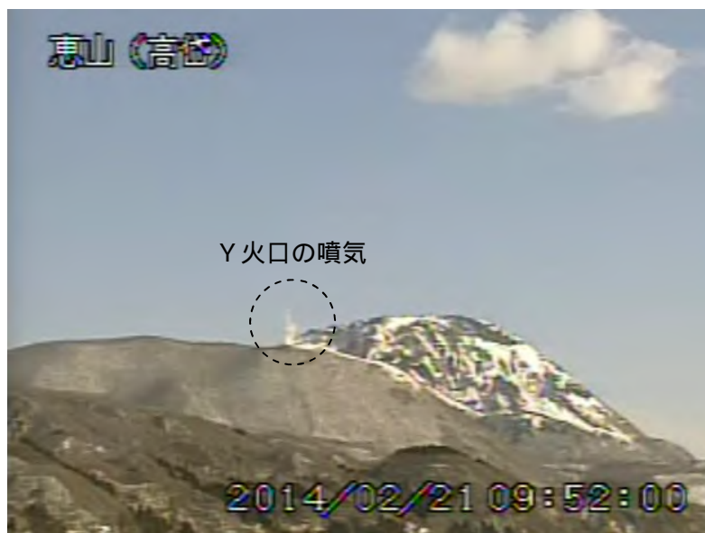
図1 恵山 西南西側から見た山頂部の状況（2月21日、 たかだい 高出遠望カメラによる）

1) 気象庁では衛星測位システムを用いた位置測定を、これまで「GPS観測」と表記してきましたが、今後は「GNSS観測」と表記します。GNSS（Global Navigation Satellite Systems）とは、GPSをはじめとする衛星測位システム全般を示す呼称です。