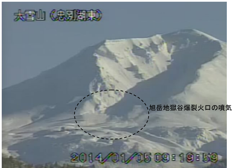
図2 大雪山 西側から見た旭岳の状況 (1月5日、忠別湖東遠望カメラによる)