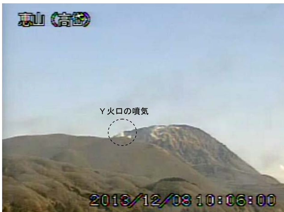
図1 恵山 西南西側から見た山頂部の状況（12月8日、 たかだい 高岱遠望カメラによる）

この火山活動解説資料は札幌管区気象台のホームページ( http://www.jma-net.go.jp/sapporo/ )や気象庁のホームページ( http://www.seisvol.kishou.go.jp/tokyo/volcano.html )でも閲覧することができます。