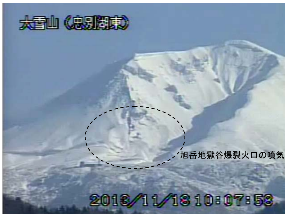
図2 大雪山 西側から見た旭岳の状況 (11月18日、忠別湖東遠望カメラによる)