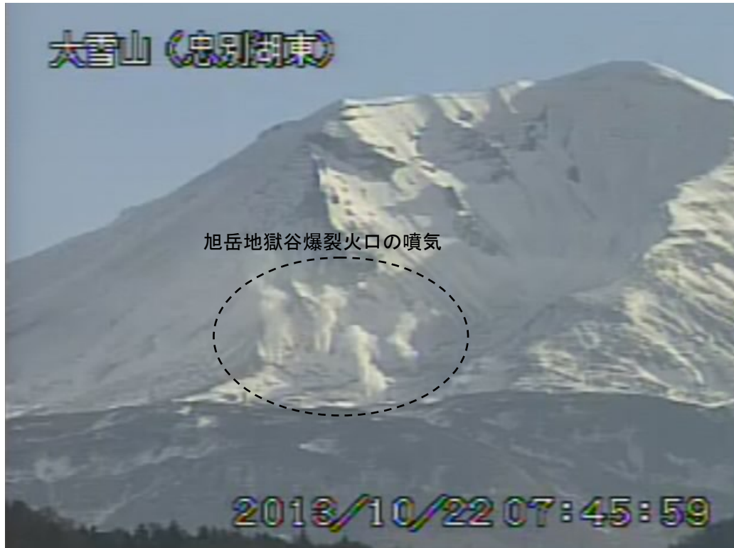
図2 大雪山 西側から見た旭岳の状況 (10月22日、 ちゅうべつこひがし 忠別湖東遠望カメラによる)