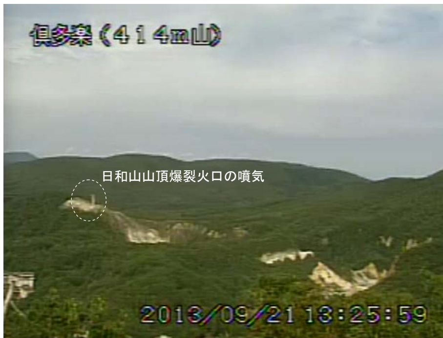
図2 倶多楽 南南西側から見た日和山、大湯沼及び地獄谷周辺の状況（9月21日、414m山遠望カメラによる）