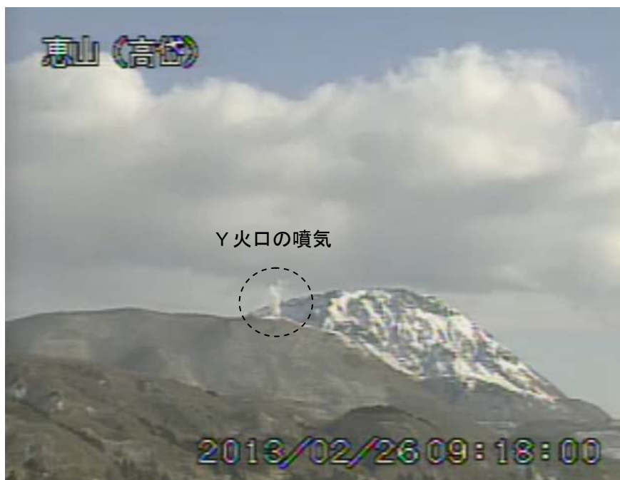
図1 恵山 山頂部の状況（2月26日、 たかだい 高岱遠望カメラによる）

この火山活動解説資料は札幌管区気象台のホームページ( http://www.jma-net.go.jp/sapporo/ )や気象庁のホームページ( http://www.seisvol.kishou.go.jp/tokyo/volcano.html )でも閲覧することができます。