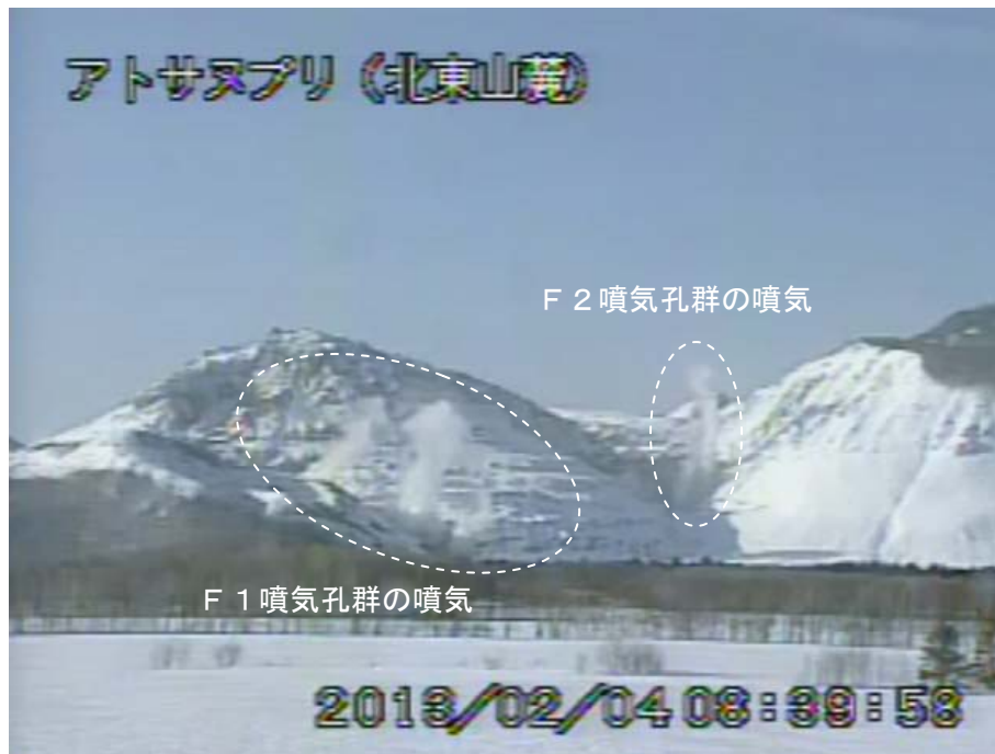
図 2 アトサヌプリ 北東側から見た山体の状況 （2月4日、北東山麓遠望カメラによる）