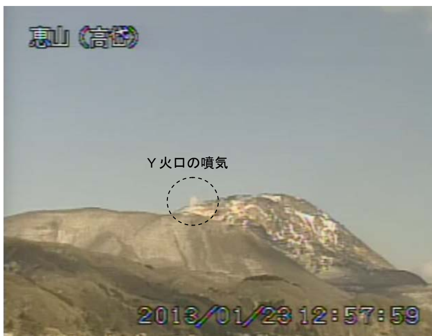
図1 恵山 山頂部の状況（1月23日、 たかだい 高岱遠望カメラによる）

この火山活動解説資料は札幌管区気象台のホームページ( http://www.jma-net.go.jp/sapporo/ )や気象庁のホームページ( http://www.seisvol.kishou.go.jp/tokyo/volcano.html )でも閲覧することができます。