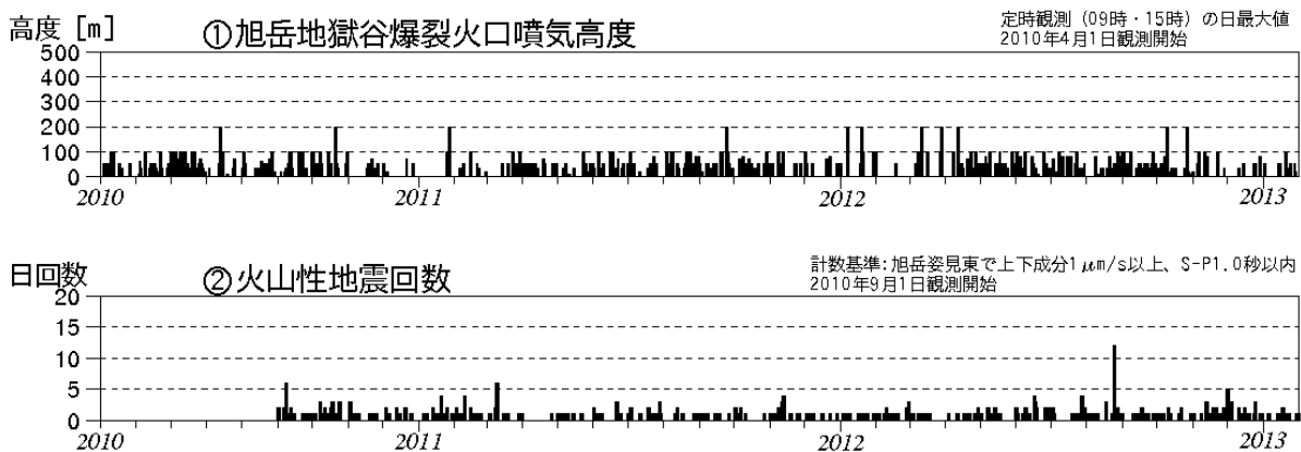
図1 大雪山 火山活動経過図（2010年4月～2013年1月）

この火山活動解説資料は札幌管区気象台のホームページ( http://www.jma-net.go.jp/sapporo/ )や気象庁のホームページ( http://www.seisvol.kishou.go.jp/tokyo/volcano.html )でも閲覧することができます。