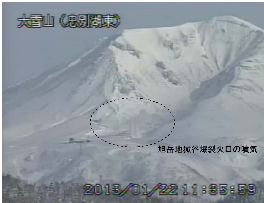
図2 大雪山 西側から見た旭岳の状況（1月22日、忠別湖東遠望カメラによる）