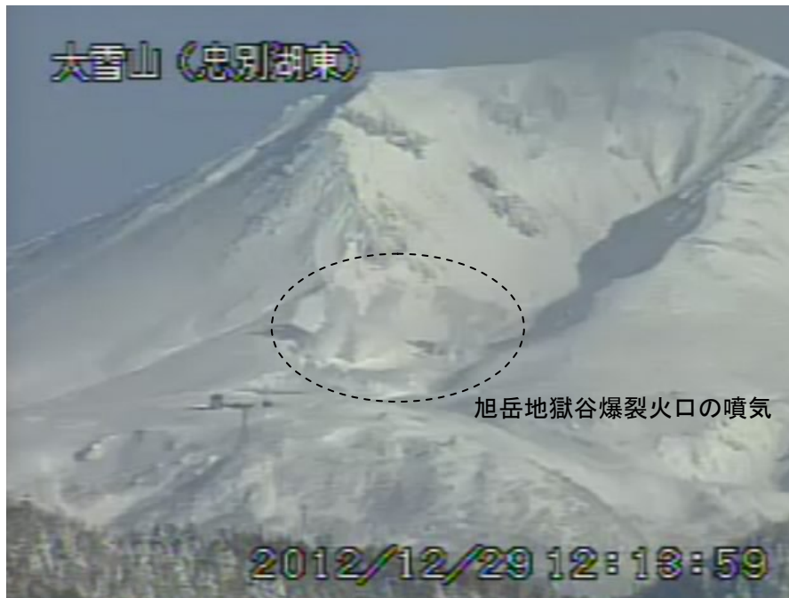
図2 大雪山 旭岳西側の状況 (12月29日、忠別湖東遠望カメラによる)