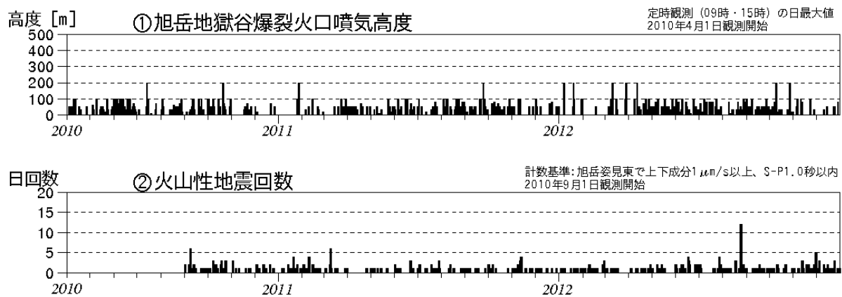
図1 大雪山 火山活動経過図（2010年4月～2012年12月）

この火山活動解説資料は札幌管区气象台のホームページ( http://www.jma-net.go.jp/sapporo/ )や気象庁のホームページ( http://www.seisvol.kishou.go.jp/tokyo/volcano.html )でも閲覧することができます。