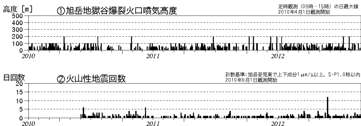
図1 大雪山 火山活動経過図（2010年4月～2012年11月）

この火山活動解説資料は札幌管区气象台のホームページ( http://www.jma-net.go.jp/sapporo/ )や気象庁のホームページ( http://www.seisvol.kishou.go.jp/tokyo/volcano.html )でも閲覧することができます。