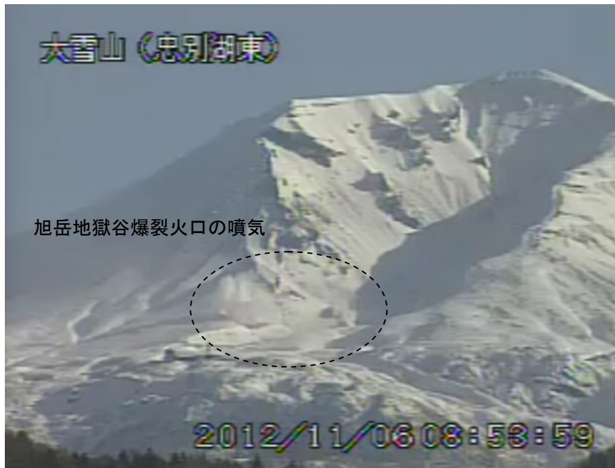
図2 大雪山 旭岳西側の状況 (11月6日、忠別湖東遠望カメラによる)