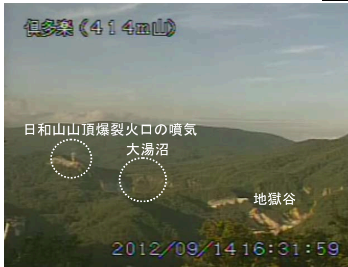
図 2 倶多楽 日和山、大湯沼及び地獄谷周辺の状況 (9月14日、414m山遠望カメラによる)