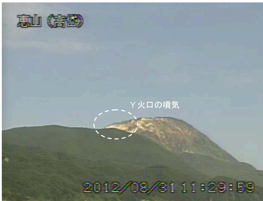
図1 恵山 山頂部の状況（8月31日、 たかだい 高岱遠望カメラによる）

この火山活動解説資料は札幌管区気象台のホームページ( http://www.jma-net.go.jp/sapporo/ )や気象庁のホームページ( http://www.seisvol.kishou.go.jp/tokyo/volcano.html )でも閲覧することができます。