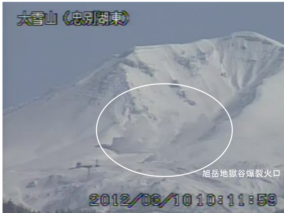
図 2 大雪山 旭岳西側の状況 (3月10日、忠別湖東遠望カメラによる) 白丸内は旭岳地獄谷爆裂火口の噴気