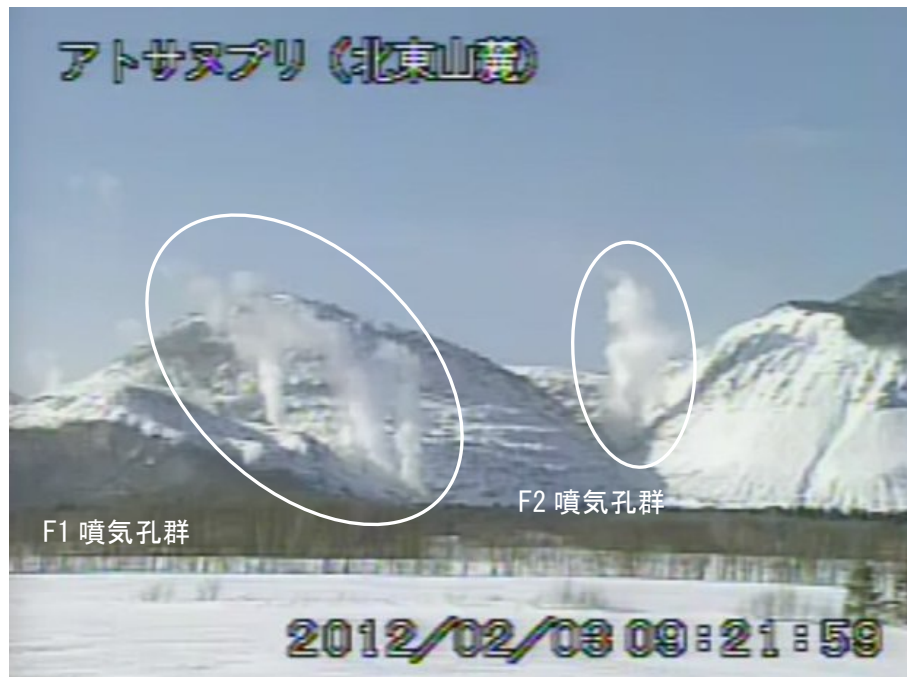
図2 アトサヌプリ 山体北側の状況（2月3日、北東山麓遠望カメラによる） 白丸内はF1噴気孔群及びF2噴気孔群からの噴気