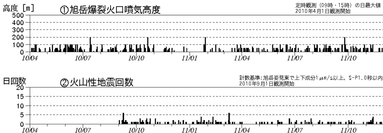
図 1 大雪山 火山活動経過図（2010 年 4 月～2011 年 11 月）

この火山活動解説資料は札幌管区気象台のホームページ( http://www.jma-net.go.jp/sapporo/ )や気象庁のホームページ( http://www.seisvol.kishou.go.jp/tokyo/volcano.html )でも閲覧することができます。