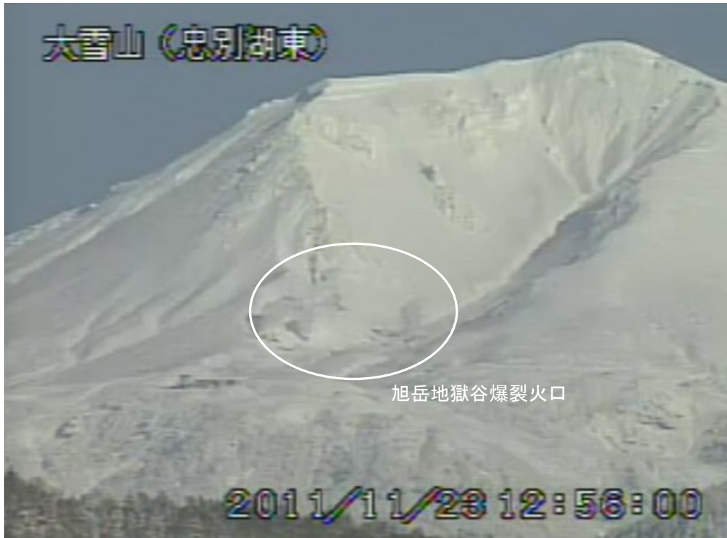
図2 大雪山 旭岳西側の状況 (11月23日、忠別湖東遠望カメラによる) 白丸内は旭岳地獄谷爆裂火口の噴気