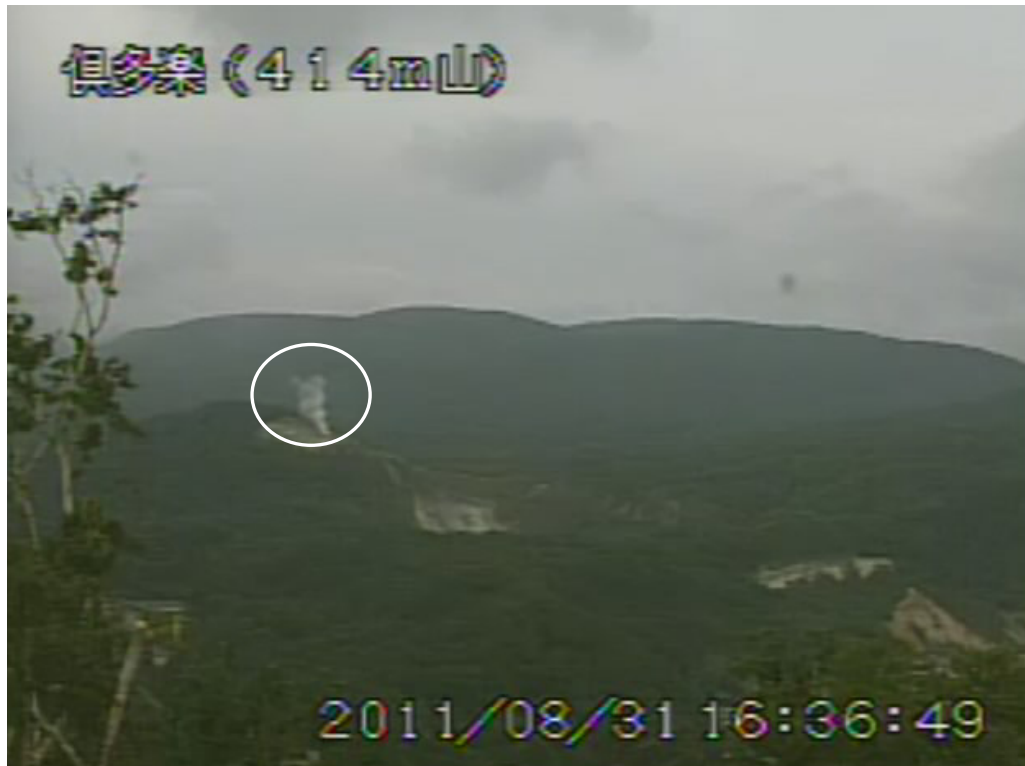
図2 倶多楽 日和山及び大湯沼周辺の状況 (8月31日、414m山遠望カメラによる) 白丸内は日和山山頂爆裂火口の噴気