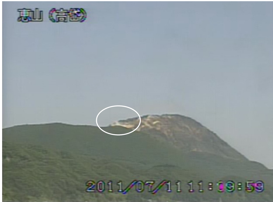
図2 恵山 山頂ドーム南西側の状況 (7月11日、高岱遠望カメラによる) 白丸内は爆裂火口からの噴気