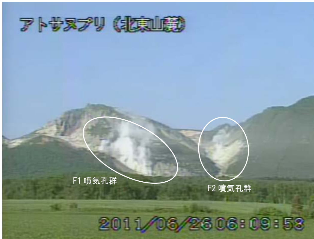
図2 アトサヌプリ 山体北側の状況 (6月26日、北東山麓遠望カメラによる) 白丸内はF1 噴気孔群及びF2 噴気孔群からの噴気