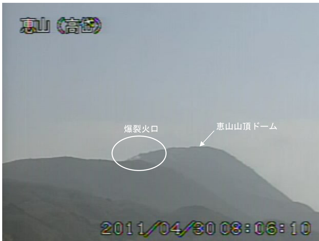
図2 恵山 山頂ドーム西側の状況 (4月30日、高岱遠望カメラによる) 白丸内は爆裂火口からの噴気