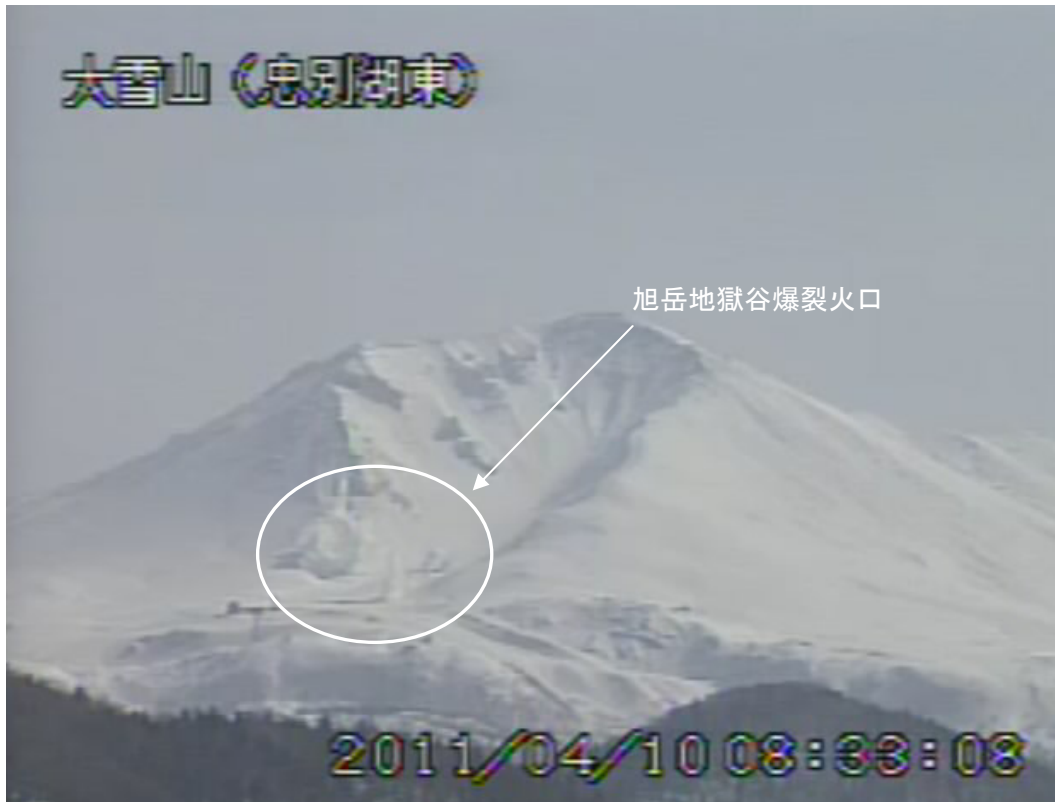
図2 大雪山 旭岳西側斜面の状況 (4月10日、忠別湖東遠望カメラによる) 白丸内は旭岳地獄谷爆裂火口の噴気