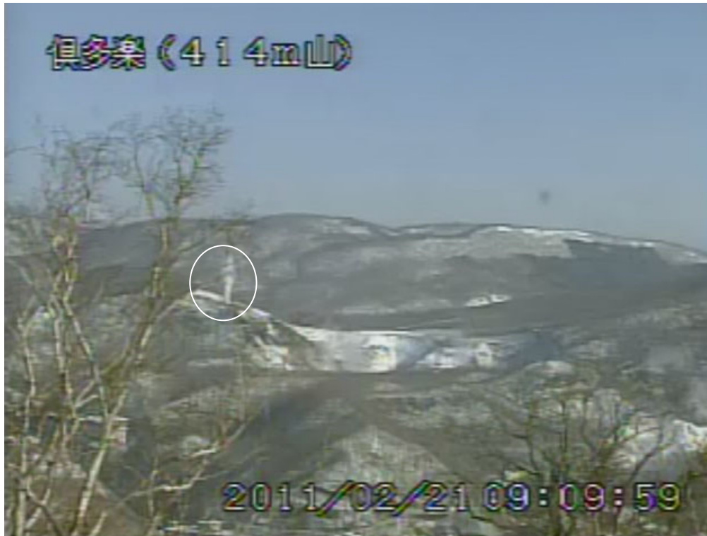
図2 倶多楽 日和山山頂爆裂火口からの噴煙の状況 (2月21日) 414m山に設置した遠望カメラ (爆裂火口から南南西1.9km) による。 白丸内が噴煙で、高さは火口縁上約50m。