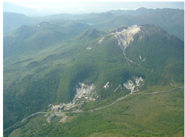
図 2 ニセコ イワオヌプリ山頂付近の状況 (2008 年 6 月 18 日 図 1 の①方向上空より撮影)