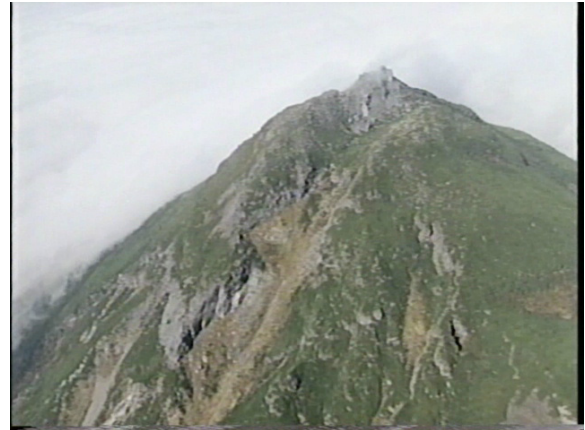
図 2 羅臼岳（2006 年 10 月 5 日、 周辺図②から撮影）