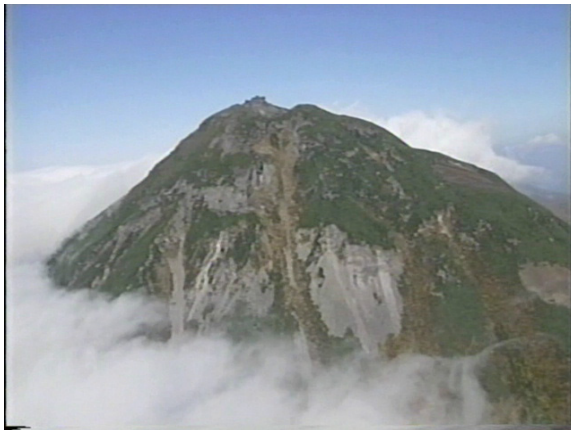
図 1 羅臼岳（2006 年 10 月 5 日、 周辺図①から撮影）

5 日に北海道開発局の協力で実施した上空からの観測では噴気などは認められず、前回（2003 年 6 月 6 日）と比べて特に変化はありませんでした。