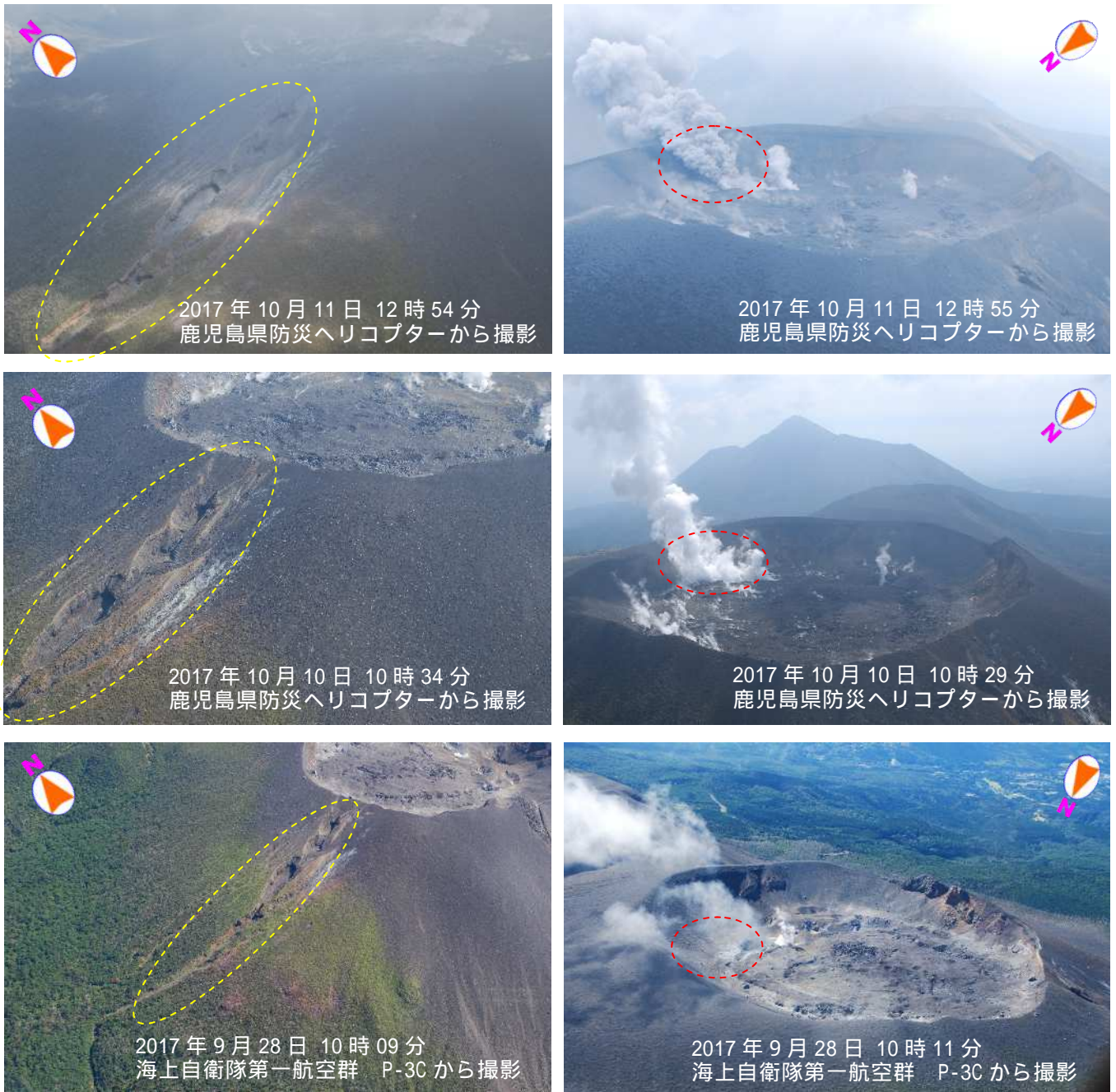
図2 霧島山（新燃岳） 新燃岳南西側と火口内の状況