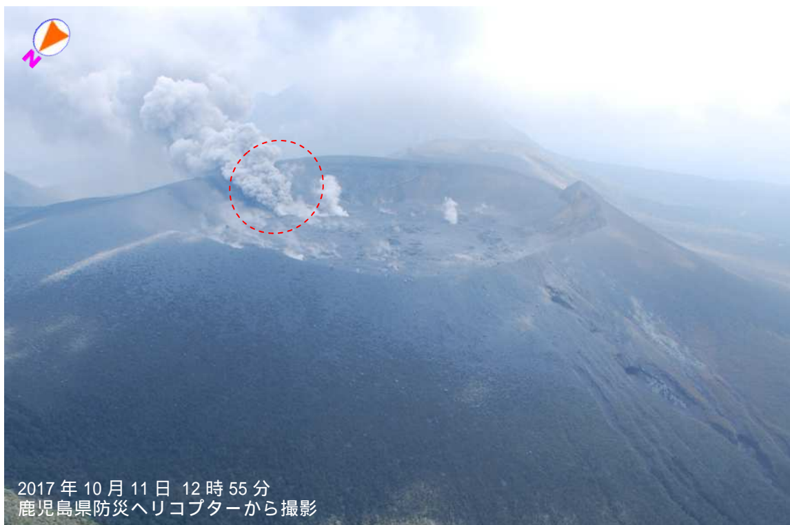
図 1 霧島山（新燃岳） 火口内の状況

火口内の東側付近（図の赤破線）から、灰白色の噴煙が火口縁上 700m まで上がり東側に流れていました。弾道を描いて飛散する大きな噴石は確認されませんでした。