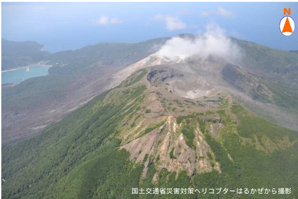
図3 口永良部島 古岳火口の状況(2014年8月6日14時29分) これまでの調査と比べ、古岳火口内の状況には、特段の変化は認められませんでした。