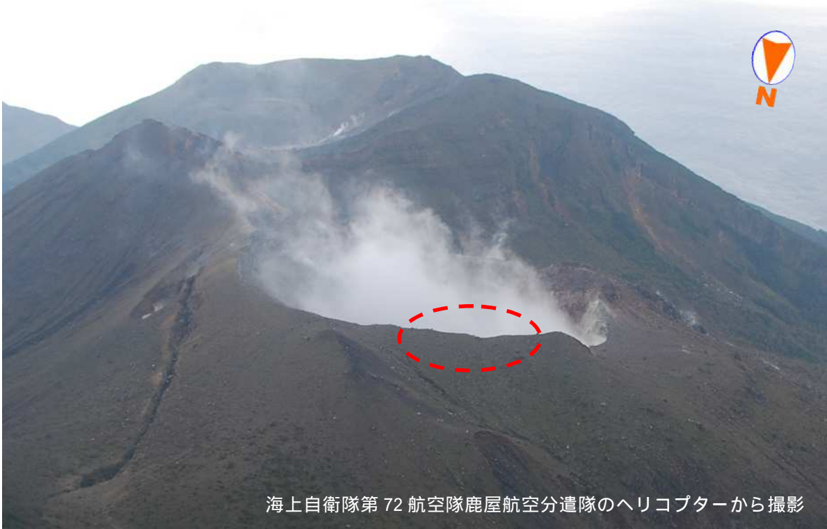
図 2 口永良部島 新岳火口付近の状況 上図 2014 年 8 月 6 日 14 時 16 分 下図 2011 年 12 月 19 日 12 時 56 分 新岳火口の北側の一部がわずかに広がっていました（赤破線内）。