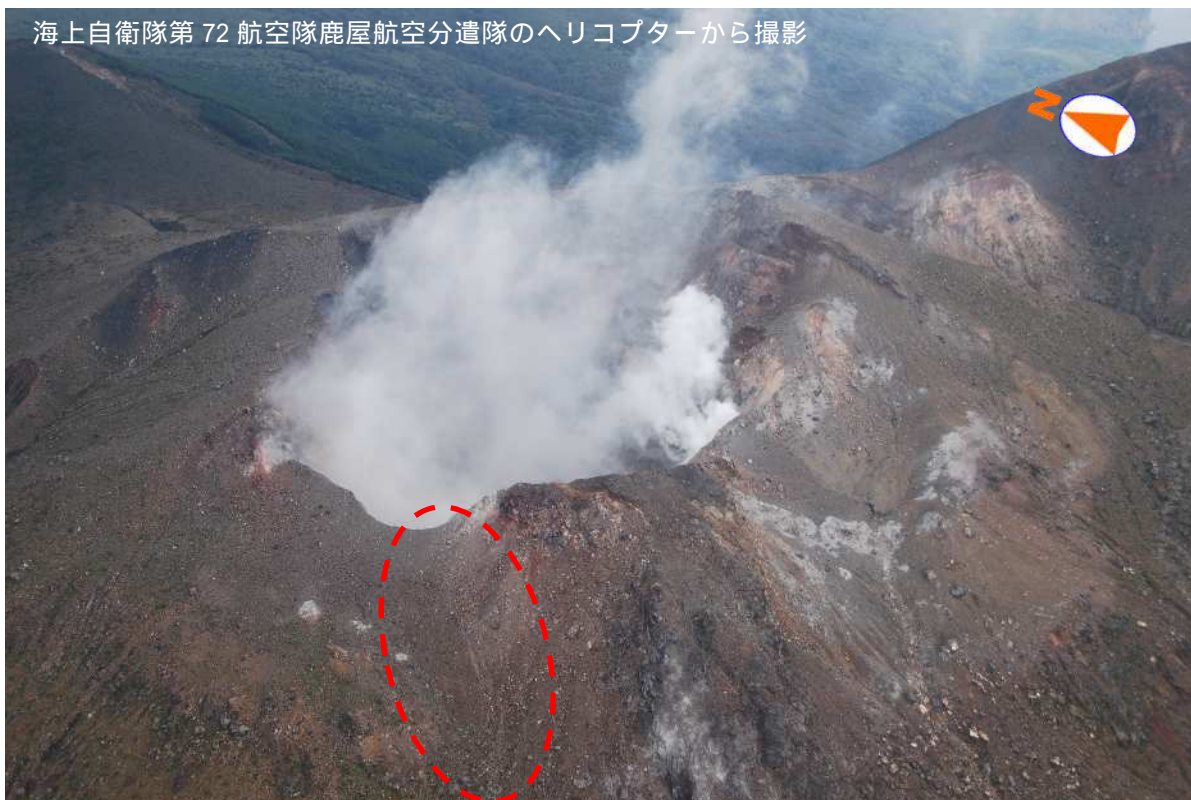
図 1 口永良部島 新岳火口付近の状況 上図 2014 年 8 月 6 日 14 時 18 分 下図 2011 年 12 月 19 日 12 時 58 分 新岳火口縁の南西側に 8 月 3 日の噴火に伴う新たな割れ目を確認しました（赤破線内）。