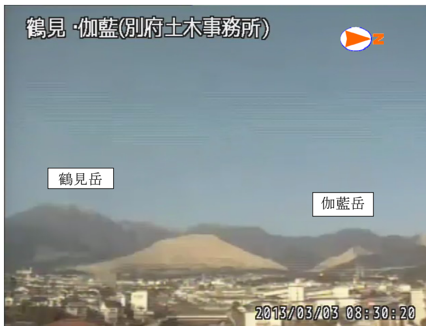
図 1※ 鶴見岳・伽藍岳 鶴見岳・伽藍岳の状況 （3 月 3 日、鶴見岳監視カメラ（大分県）による）

この火山活動解説資料は福岡管区气象台ホームページ（ http://www.jma-net.go.jp/fukuoka/ ）や気象庁ホームページ（ http://www.seisvol.kishou.go.jp/tokyo/volcano.html ）でも閲覧することができます。次回の火山活動解説資料（平成 25 年 4 月分）は平成 25 年 5 月 10 日に発表する予定です。