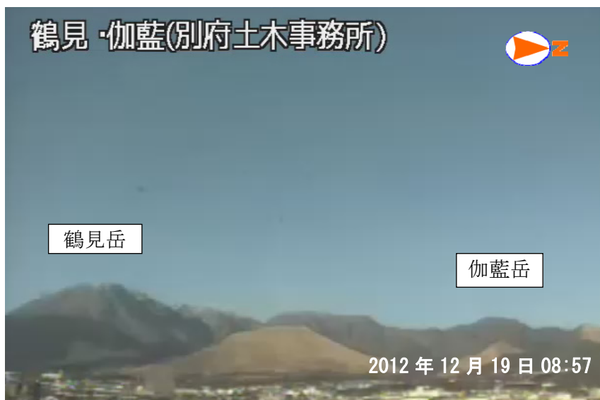
図 1※ 鶴見岳・伽藍岳 鶴見岳・伽藍岳の状況 (12 月 19 日、鶴見岳監視カメラ（大分県）による)

この火山活動解説資料は福岡管区気象台ホームページ ( http://www.jma-net.go.jp/fukuoka/ ) や気象庁ホームページ ( http://www.seisvol.kishou.go.jp/tokyo/volcano.html ) でも閲覧することができます。次回の火山活動解説資料（平成 25 年 1 月分）は平成 25 年 2 月 7 日に発表する予定です。