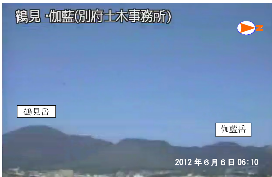
図 1※ 鶴見岳・伽藍岳 遠望カメラによる鶴見岳・伽藍岳の状況 （6 月 6 日、鶴見岳監視カメラ（大分県）による）

この火山活動解説資料は福岡管区气象台ホームページ（ http://www.jma-net.go.jp/fukuoka/ ）や気象庁ホームページ（ http://www.seisvol.kishou.go.jp/tokyo/volcano.html ）でも閲覧することができます。次回の火山活動解説資料（平成 24 年 7 月分）は平成 24 年 8 月 7 日に発表する予定です。 ※この資料は気象庁のほか、国土地理院、独立行政法人防災科学技術研究所、大分県のデータも利用して作成しています。