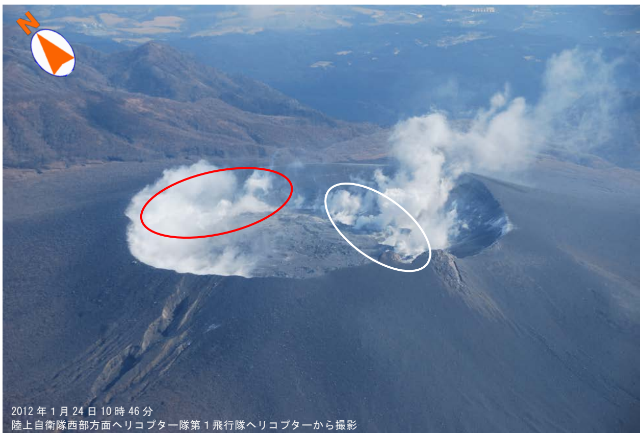
図 1 霧島山（新燃岳） 火口内の状況